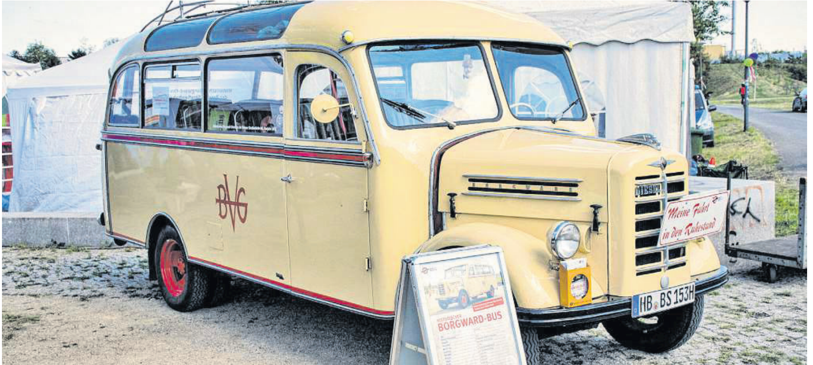
Zehn Personen finden im Borgward-Bus der BSAG Platz. Dieser fährt Besucher der HEVIE am Sonntag durch den Stadtteil.

HEVIE mit besonderer Aktion für Oldtimerfreunde und Geschichtsinteressierte: Am Sonntag tourt der Borgward-Bus durch Hemelingen