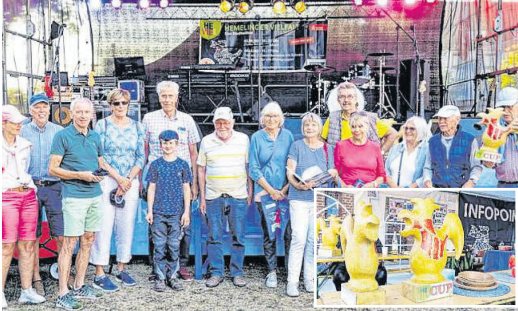
Beim HEVIE-CUP haben jedes Mal aufs Neue wieder alle Altersgruppen Spaß. Wer sich in diesem Jahr die begehrte Holztröphäe sichert, stellt sich am ersten Tag der HEVIE heraus.