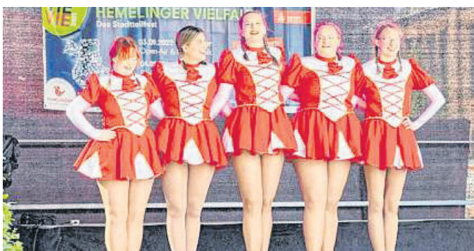
Nicht nur die roten Kostüme, sondern auch die Auftritte der Tänzerinnen des Karnevalsvereins Rot-Weiß Bremen sind ein Hingucker.

In der Hemelinger Umwelt-Jurte dreht sich alles um Gesundheit und Ernährung: Für Kinder gibt es ein Ratespiel mit Fühlkästen. Außerdem versprechen ein Schmink-Stand vom SOS-Kinderdorf und dem Bürgerhaus Hemelingen jede Menge Spaß für die jungen Gäste.