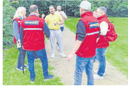
Gut erkennbar an ihren roten Westen: die Nachwanderer.

räder für die Teilnehmerinnen und Teilnehmer organisierte. Das ATLANTIC Hotel Galopprennbahn stellte den Akteuren ein Übungsareal zur Verfügung. Beamte der Verkehrswacht Bremen-Stadt bauten dort einen Übungspar-