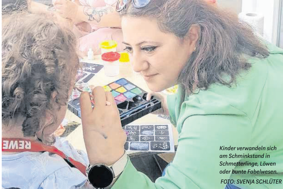
Kinder verwandeln sich am Schminkstand in Schmetterlinge, Löwen oder bunte Fabelwesen.

Diese ist auf der HEVIE eine feste Institution. Auf der Gewerbechau zeigen sich Unternehmen aus den Bereichen Dienstleis-