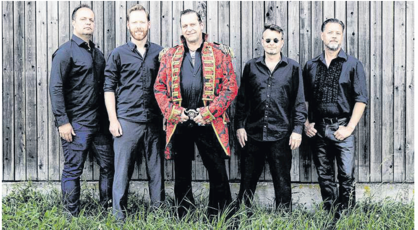
Die Bremer Band Captain Candy rockt am Sonnabend ab 19 Uhr die Bühne.

bea.linnert@baumbuero.de Hastedter Osterdeich 222 28207 Bremen